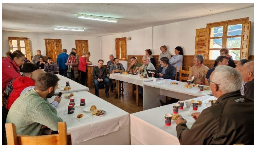
Ilustración 4 Desayuno ofrecido por la Asociación de Vecinos, en la Casa del Pueblo de Valle de Lago