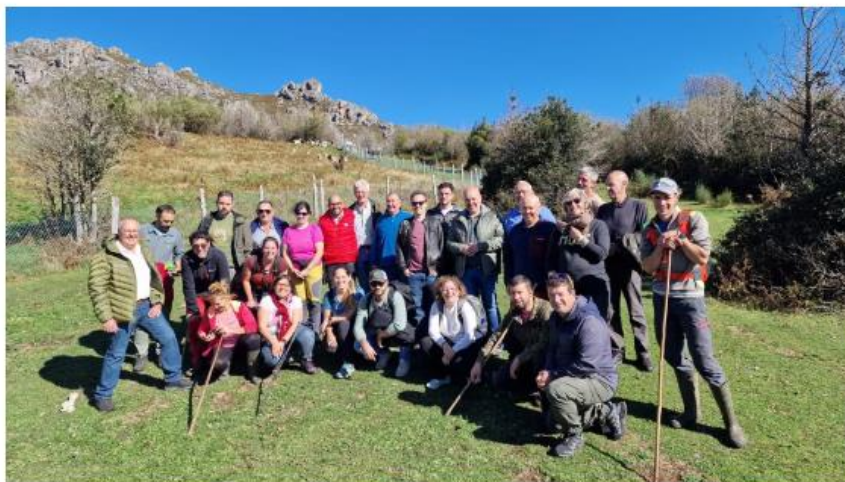
Participantes en el encuentro

La Pola y Valle del Lago acogen un encuentro de expertos y ganaderos para compartir experiencias de manejo de rebaños comunales