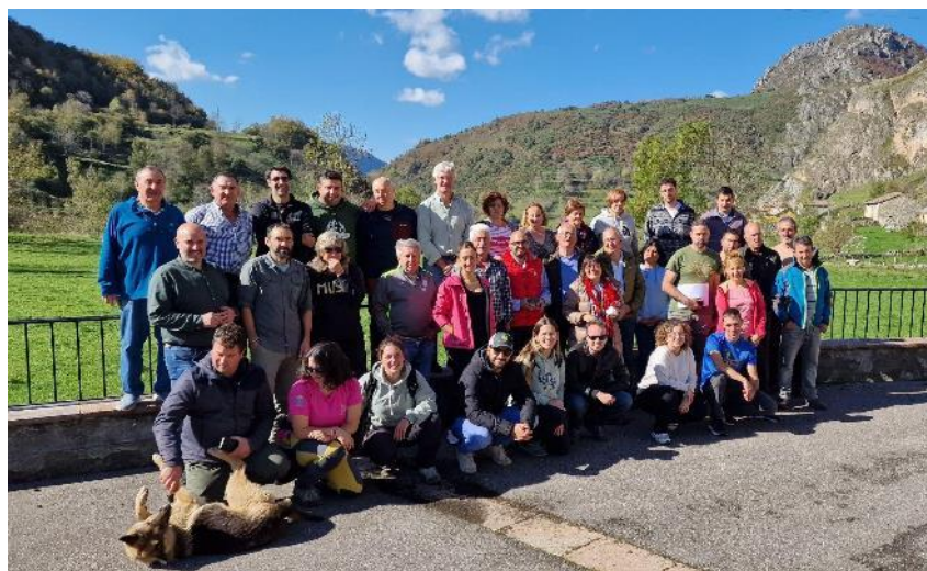
Ilustración 3 Foto de grupo con ganaderos y pastores de Valle de Lago y Somiedo y representantes de las diferentes entidades (Valle de Lago)