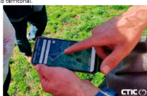
Demostración de aplicación de vallado virtual en Valle de Lago Video Pastoreo Inteligente: https://youtu.be/Y8DwST-510

Durante el encuentro, los ganaderos tuvieron la oportunidad de profundizar en las oportunidades que brinda la tecnología para manejar de rebaños comunales, y de todo ello tomó buena nota el personal técnico del Valle de Arán que acompañó en la visita. La tecnología implementada, mediante collares de vallado virtual, posibilita mejorar el pastoreo, controlar la ubicación del rebaño y conducir al ganado hacia las localizaciones que se desee, siendo una herramienta clave para la sostenibilidad territorial.