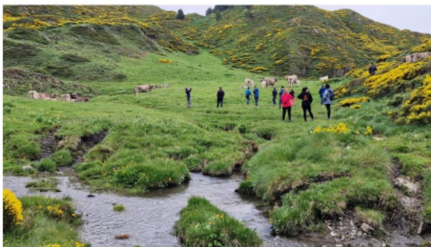
Los participantes, en una de las visitas de campo

Una delegación de Valle del Lago, acompañada de técnicos del Centro tecnológico CTIC, compartió técnicas avanzadas de pastoreo y gestión del territorio con pastores de los Pirineos