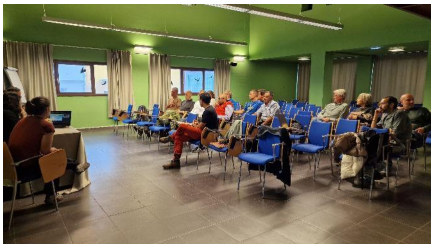
Ilustración 5 Encuentro de trabajo en el Centro de Interpretación del Parque Natural de Somiedo (Pola de Somiedo)