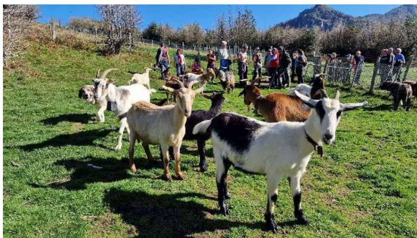
Ilustración 2 Visita al vallado en la montaña de Valle de Lago (Somiedo)