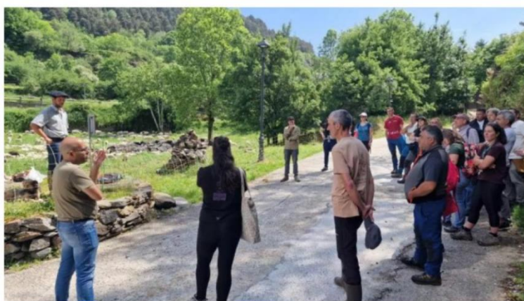
La visita de los ganaderos somedanos al Valle de Arán. / R. T. C.

Una delegación de doce ganaderos de Valle de Lago conocen las experiencias de pastoreo desarrolladas en el territorio catalán