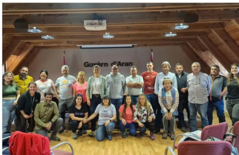
La delegación de Somiedo, con los representantes del Gobierno del Valle de Arán en Viella.

La visita se enmarca en un programa de intercambios entre comunidades pastorales que busca compartir experiencias, buenas prácticas y soluciones innovadoras