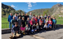
Participantes en el encuentro, en Valle de Lago

Somiedo acogió el primer encuentro del proyecto OVIHUEC.DAT al que asistieron representantes de las entidades participantes en dicha iniciativa, tres directores generales del Gobierno del Principado de Asturias y más de una docena ganaderos y ganaderas de Valle de Lago y del Valle de Arán. CTIC es una de las entidades implicadas en este proyecto y fue la encargada de organizar el encuentro que tuvo lugar en Valle de Lago, Peto de Somiedo y CTIC RuralTech entre el 22 y el 24 de octubre y que permitió conocer los resultados de la experiencia somiedana que se puso en marcha en el marco del proyecto Aldea O.