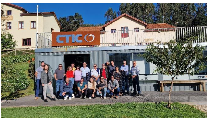
Ilustración 6 Reunión de trabajo y visita a CTIC RuralTech, Centre de Innovación Tecnológica Rural de CTIC ubicada en Peón (Villaviciosa)