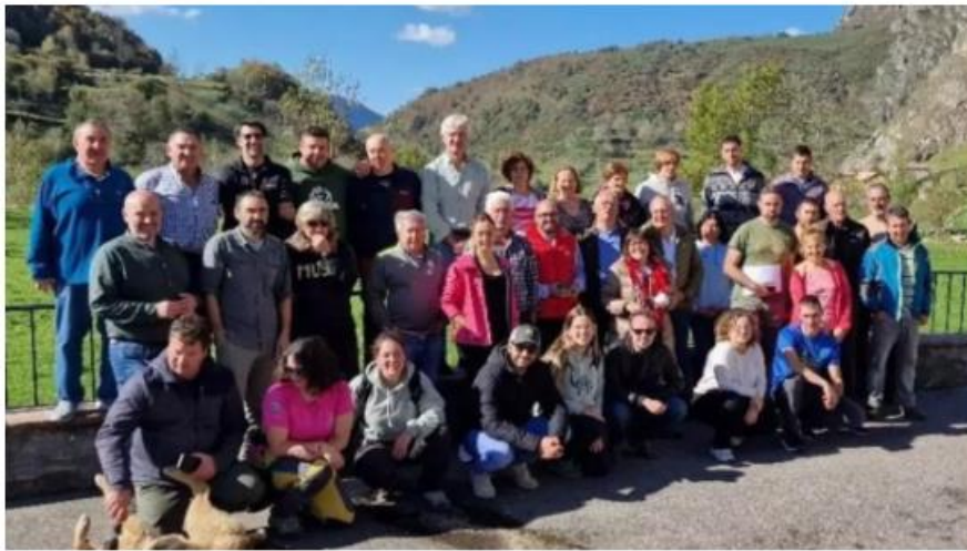
Participantes en el encuentro, en Valle del Lago, Somiedo