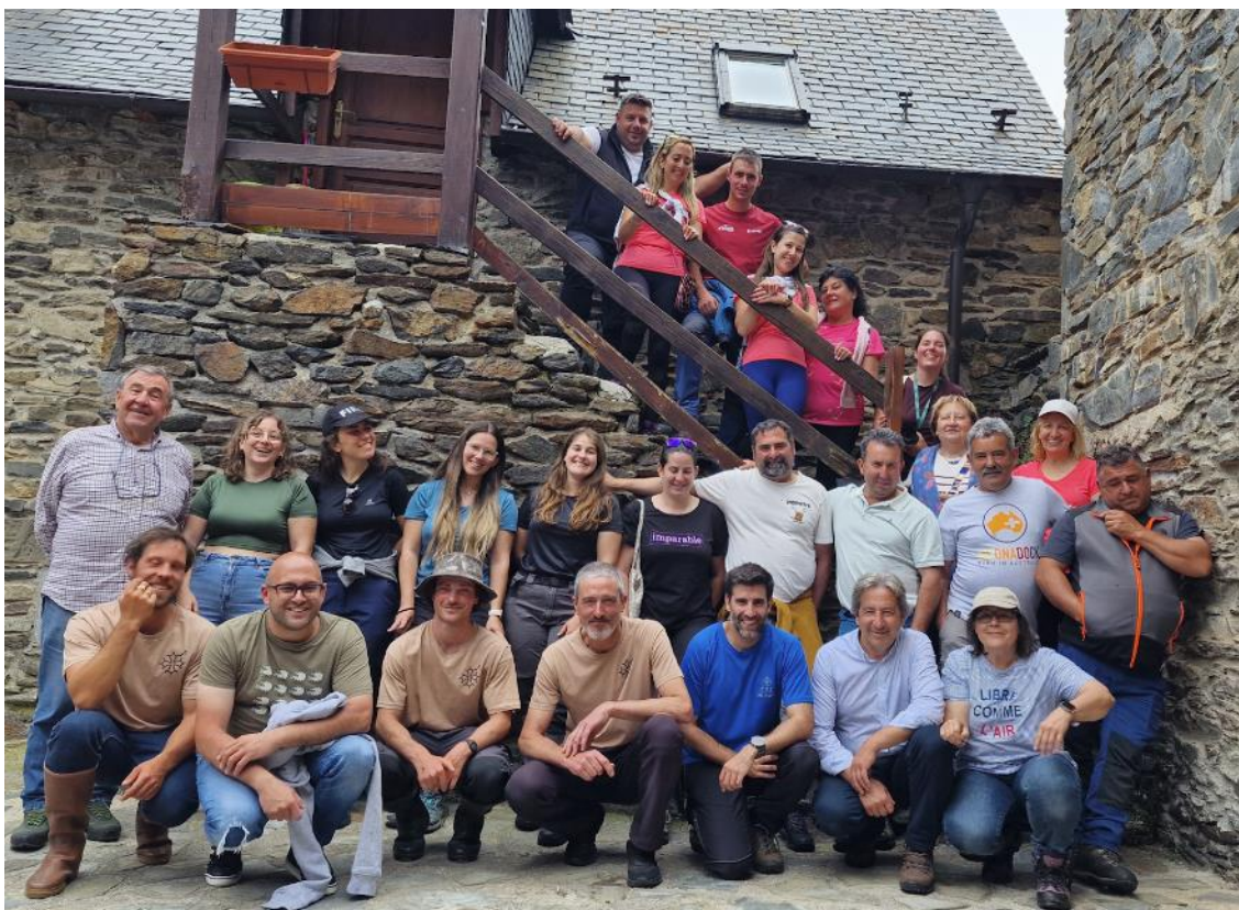
Ilustración 1: Encuentro de los ganaderos somedanos con los pastores del agrupamiento estival de Vilamós