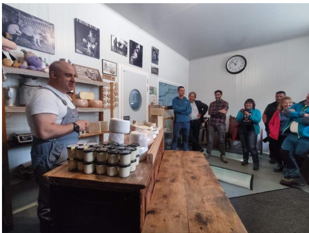
Ilustración 8 Visita a la quesería de Bagergue