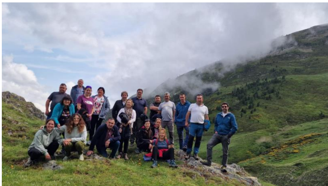
Ilustración 9 Visita a la montaña de Barradòs y aproximación a los pastos estivales del Valle de Arán.