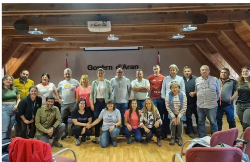
La delegación de Somiedo, con los representantes del Gobierno del Valle de Arán en Viella.

La visita se enmarca en un programa de intercambios entre comunidades pastorales que busca compartir experiencias, buenas prácticas y soluciones innovadoras