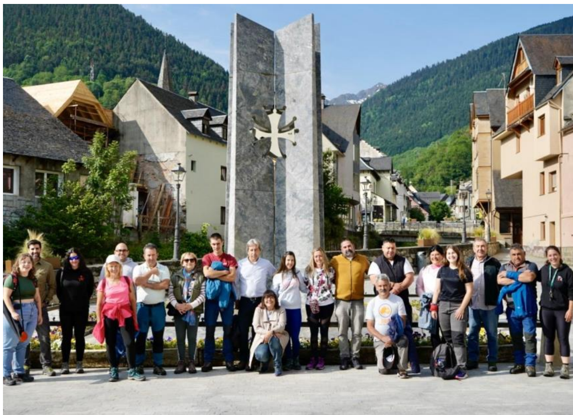
Ilustración 5 Bienvenida institucional en el Conselh Generau d'Aran de Vielha