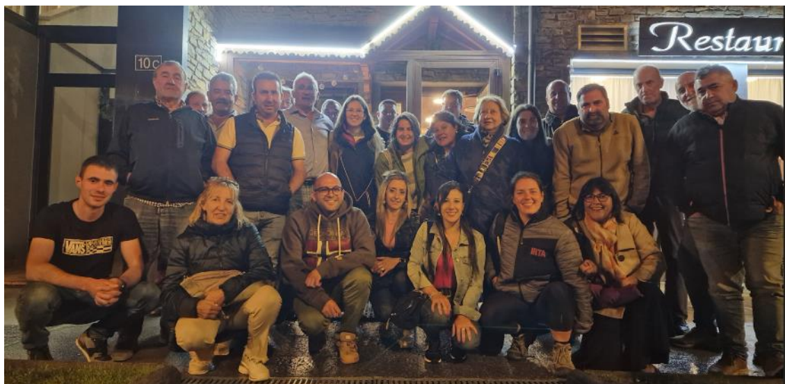
Ilustración 3 Cena de ganaderos somedanos y del valle de Arán