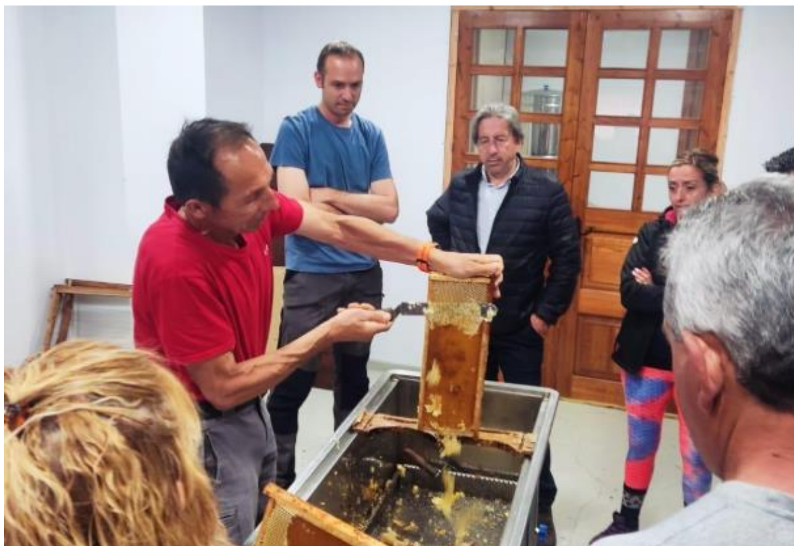
Ilustración 7 Participación a la actividad de apicultura en Garòs para descubrir una pequeña empresa familiar y sus productos